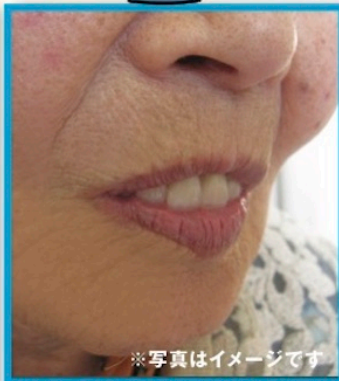
ピンと若々しい印象 ※写真はイメージです